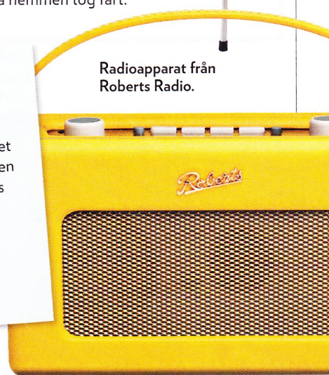
Radioapparat från Roberts Radio.

Se upp med möbelstopning som smular! På 50-talet blev det populärt med skumgummi. Men materialet är känsligt för solljus och värme. Smular din stol är det läge att stoppa om den. Vänd dig till ett proffs om du har en designmöbel.