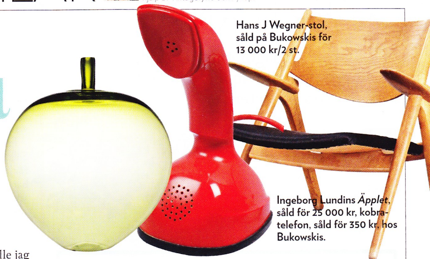
Hans J Wegner-stol, såld på Bukowskis för 13 000 kr/2 st.