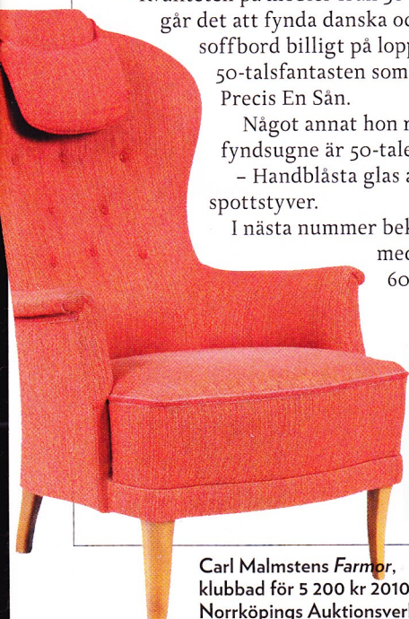
Carl Malmstens Farmor , klubbad för 5 200 kr 2010 hos Norrköpings Auktionsverk.

Radioapparaterna från Roberts Radio har samma design som på 50-talet. De är bärbara, finns i flera fina färger och skänker garanterat 50-talsglans åt din picknick. Vill du ha 50-talsmöbler finns mycket i nyproduktion. Yngve Ekström grundade företaget Swedese som i dag säljer många av hans möbler, Stringhyllan säljs och utvecklas för fullt av String och Gustavsberg nyttillverkar flera av 50-talets serviser.